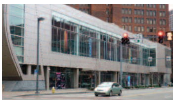
The August Wilson Center où Baobab a été présenté.

Pas mal pour une compagnie sélectionnée pour la première fois à ce prestigieux événement ! Il faut dire que la représentation du spectacle a remporté un immense succès et que de nombreuses représentations sont à prévoir à travers les Etats-Unis, du Vermont à la Californie et de l'état de Washington à la Caroline du Sud !