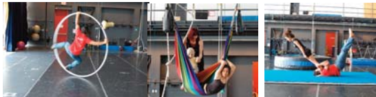
En résidence à la TOHU le printemps dernier

Dans les yeux de mon père , un spectacle en devenir avec des acrobates aériens, des comédiens, des marionnettes et des ombres!